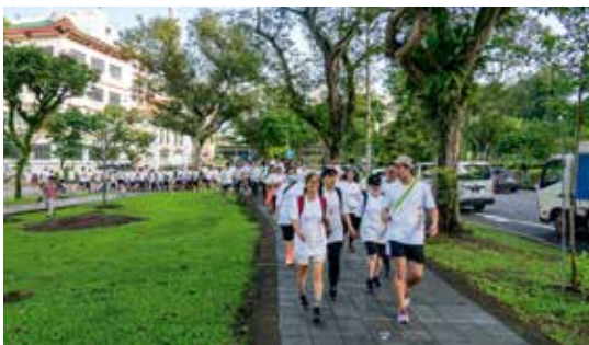
■ 健行队伍浩浩荡荡从潮州大厦出发，踏上了3.4公里的徒步之旅。