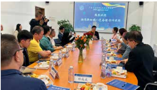
■ 19日下午部分代表访问广东以色列理工学院附属双语学校，与该校领导亲切交流。

下午出席国际潮团总会会员大会，审议通过国际潮团总会工作报告、总会2023年度财务报告、审议通过《国际潮团总会有限公司组织章程细则》、通过总会新一届理事会名单。同时部分团员前往广东以色列理工学院附属双语学校参访，还有团员出席万豪酒店召开的全球潮青菁英创新分享会暨第八届潮创大会。当晚前往潮汕历史文化博览中心北广场观看“潮青归汕濠情筑梦”——青春音乐嘉年华音乐会，也有团员前往广东潮剧院慧如剧场观看潮剧《辞郎洲》。