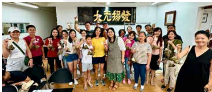
参与包粽子工作坊的学员们，每位手握自己亲手制作的两个粽子，脸上洋溢着满满的喜悦之情。

7.4.7 9月23日与11月16日，青年团足球队分别在淡滨尼战备军人俱乐部和PUB Woodleigh（兀里自来水公司场地）举办了两场足球友谊赛。