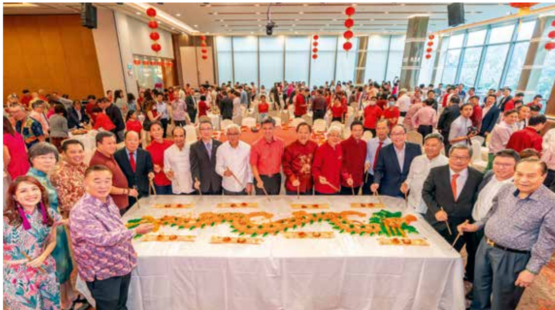
现场充满了喜庆和团聚的气氛，贵宾们聚集在龙形图案的鱼生桌前，一起捞鱼生。