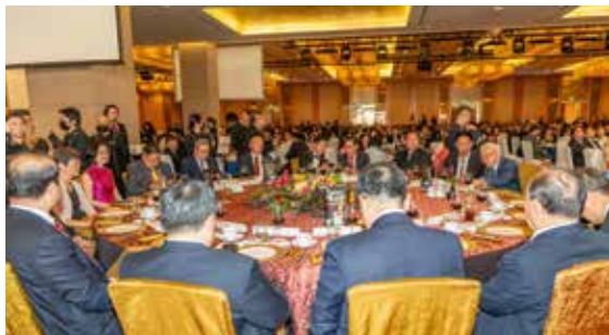
■ 滨海湾金沙宴会厅晚宴现场。