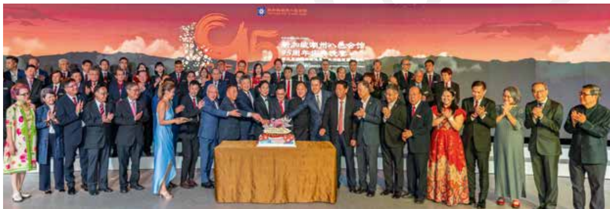
■ 宾主共同上台切蛋糕，庆祝会馆成立95周年。

11月10日晚，本会在滨海湾金沙四楼宴会厅举行盛大的95周年庆典晚宴暨第三届潮州美姐选美赛大决赛暨颁奖典礼，副总理王瑞杰担任主宾，现任部长、国会议员、前政要和多位外国使节、来自马来西亚、印度尼西亚、新西兰、中国大陆、香港、澳门等地的潮社领袖、还有本地社团及商界精英超过1200人出席。