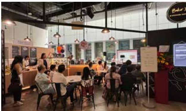
■ 专业茶艺鉴赏活动的现场。