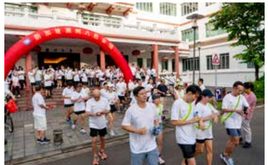
■ 大家在潮州大厦前一起热身。