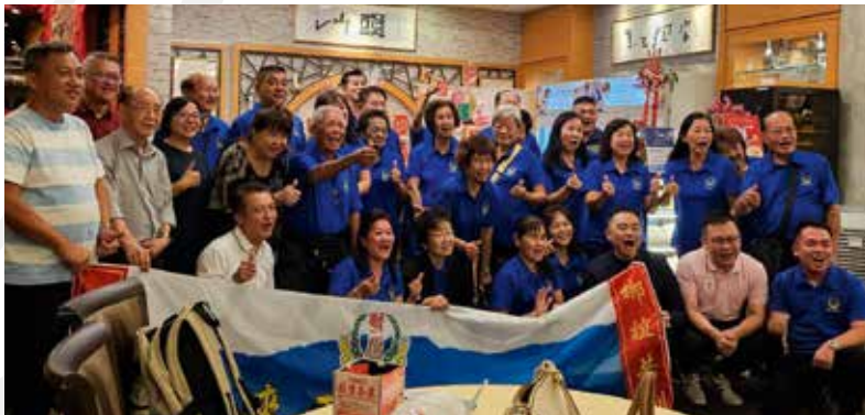
■ 在大巴窰汕头海鲜设宴欢迎马来西亚霹靂州曼绒韩江公会来访。