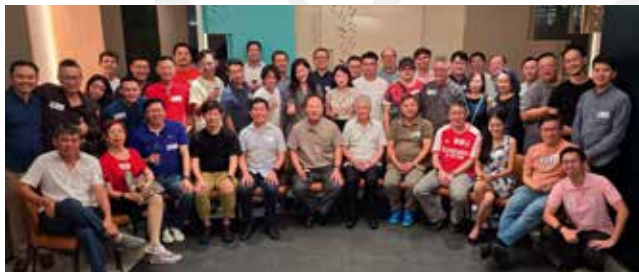
■ 出席6月7日聚餐会的组员合影。

7.3.2 6月7日，40多位组员出席在深利喫茶添味 (Chin Lee Tea & Dine) 餐馆举行的联谊聚餐，增进友谊。