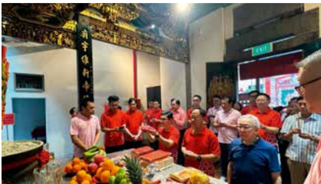
农历三月初三，适逢玄天上帝圣诞之日，董事们前往粤海清庙，虔诚祭拜并祈福祈愿。