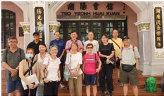
■ 参与导览活动的会员们在揭阳会馆门前合影。

7.1.13 为欢庆八邑会馆成立95周年，本会馆再度与新加坡潮州文史学会合作，9月期间联办五场公开潮语及华/英语导览活动，带领总数近60名的会员参访晚晴园，在晚晴园——孙中山纪念馆闭馆装修前，探索潮州先贤在辛亥革命中的重要贡献，也在《实叻潮迹：