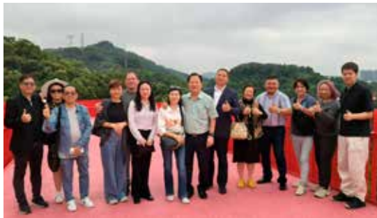
■ 17日早上访问团游览光明地标虹桥公园。