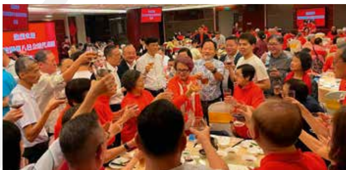
17日两队人马汇集在汕头国际大酒店，与潮汕三市侨务领导、乡亲们共进晚餐。

17日晚出访潮汕的两队人马汇集在汕头国际大酒店，举行欢聚晚宴，同时邀请汕头、潮州、揭阳市侨务局领导近20位，还有中国潮社、组织的领导共计150多人参加。席间“潮州人·家己人”歌声此起彼伏，欢声笑语不断，乡亲们把酒言欢，畅叙乡谊。晚宴在“兴、顺、发”的祝酒声中结束。