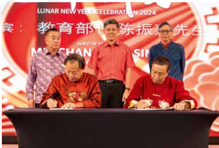
■ 陈振声部长见证奖学金的签署仪式。站立者左起：署理会长吴佶财、陈振声部长、新加坡营销商学院院长刘杰辉教授；第一排左起：会长吴木興、新加坡营销商学院主席袁伟成。

活动现场充满了喜庆和团聚的气氛，与会嘉宾相互祝愿新年吉祥如意，生活幸福美满，期待新的一年会务蓬勃发展，为潮州乡亲们带来更多的福祉和机遇。