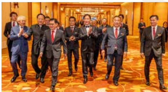
■ 迎接副总理王瑞杰进入会场。

新加坡副总理王瑞杰在致辞中赞扬八邑会馆积极推广华族文化，培育双语双文化人才，并提到会馆与新加坡社科大学合作推出《潮商大师班》文凭课程，为会员提供华人