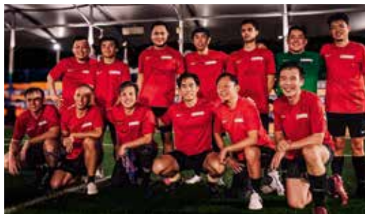
青春洋溢的青年团足球队队员合影，铭记时光。