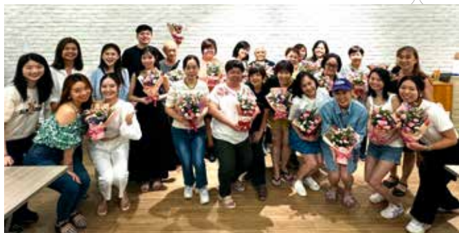
■ 学员们满心欢喜地手捧插花作品拍照。