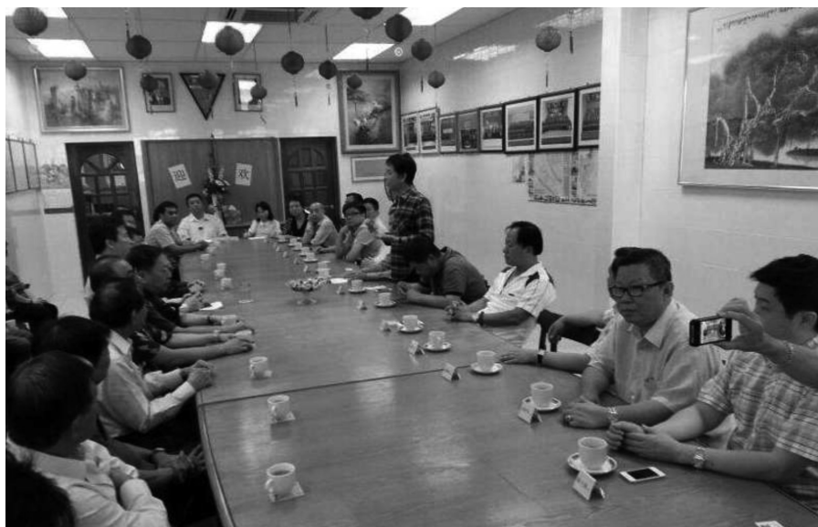
本会馆拜会澄海会馆