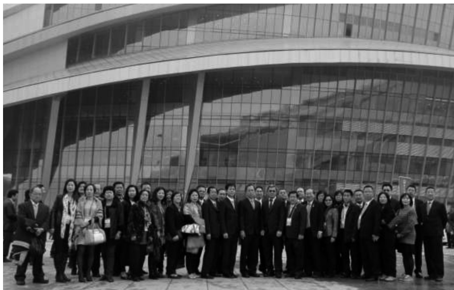
参加第17届国际潮团联谊年会全体代表合影