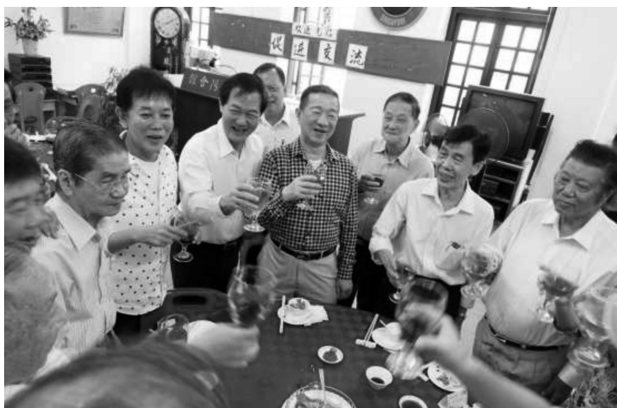
本会馆拜会潮阳会馆