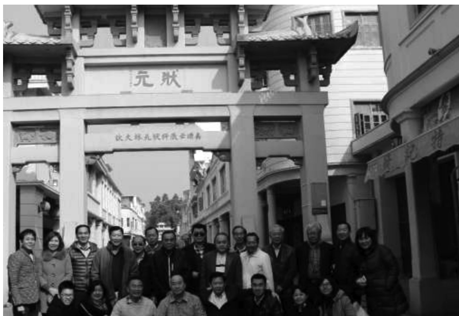
12月潮汕民俗文化考察团全体成员合影