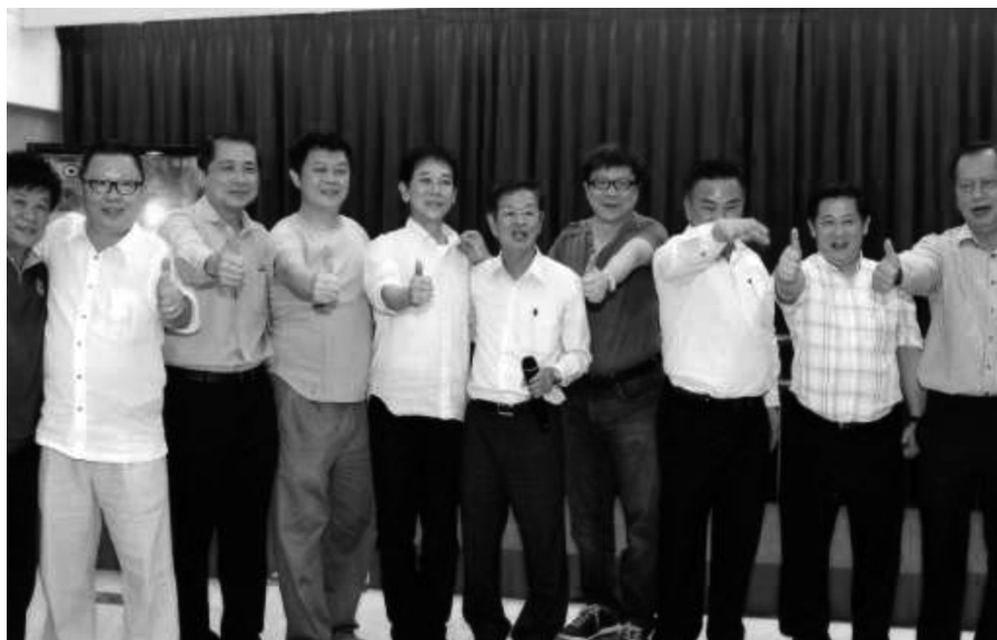
本会馆拜会潮安会馆