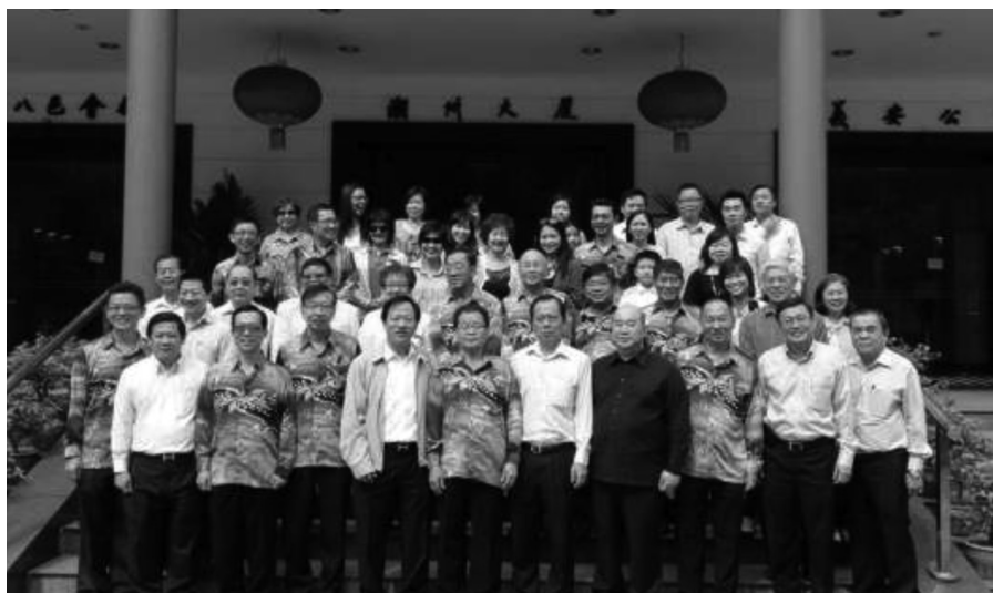
马来西亚雪隆潮州会馆访问本会馆