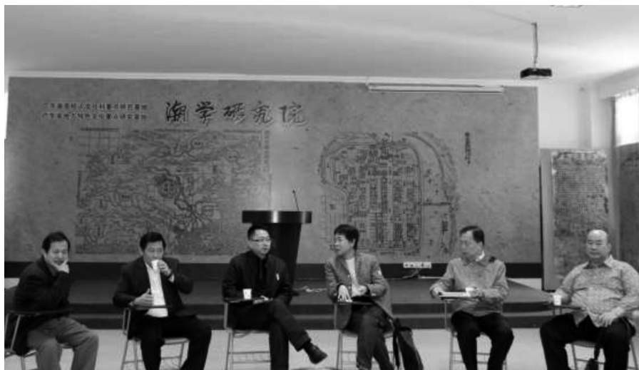
12月潮汕民俗文化考察团访问韩山师范学院潮学研究院