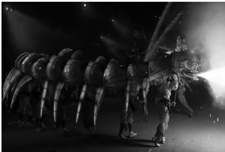
本会馆赞助妆艺游行“蜈蚣舞”表演