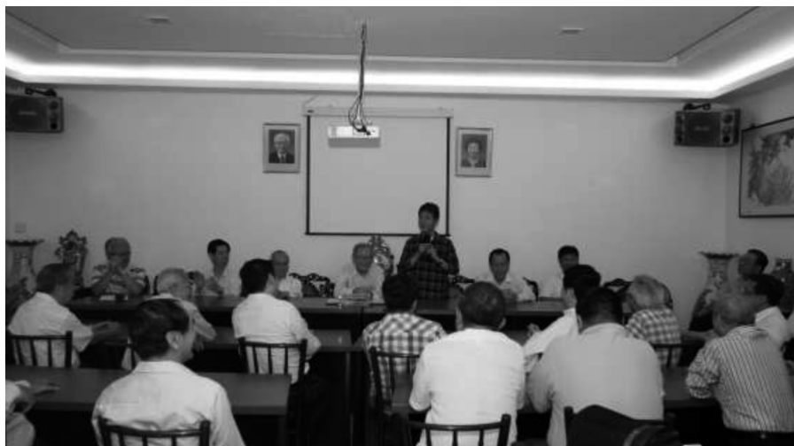
本会馆拜会揭阳会馆