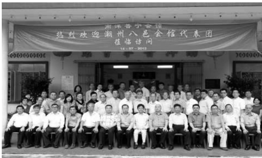
本会馆拜会普宁会馆