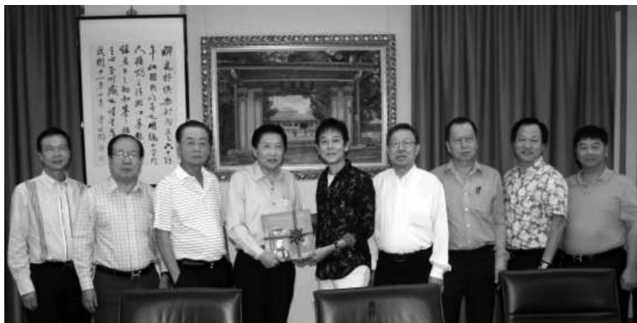
本会馆拜会醉花林俱乐部