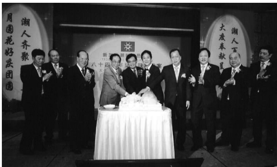
84周年纪念晚宴，敦请教育部长王瑞杰为主宾