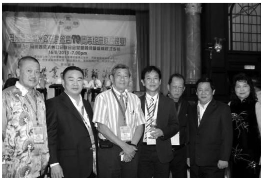
本会馆组团出席马来西亚潮州公会联合会79周年纪念联欢晚宴