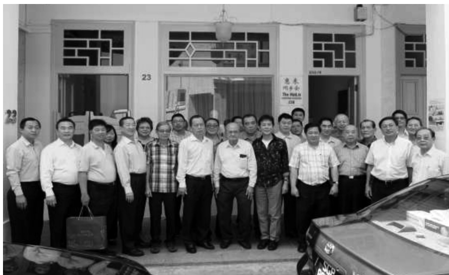
本会馆拜会惠来同乡会