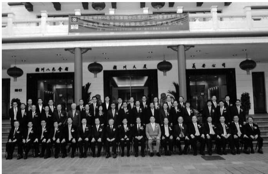
第42届董事就职典礼 敦请总理公署部长林瑞生先生主持监誓仪式